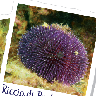
Riccio di Prateria

"La natura è il miglior artista ed il più umile, sta a noi tentare di raccogliere le infinite diversità delle sue proposte." [Andrea Izzotti]