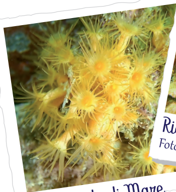
Margherita di Mare